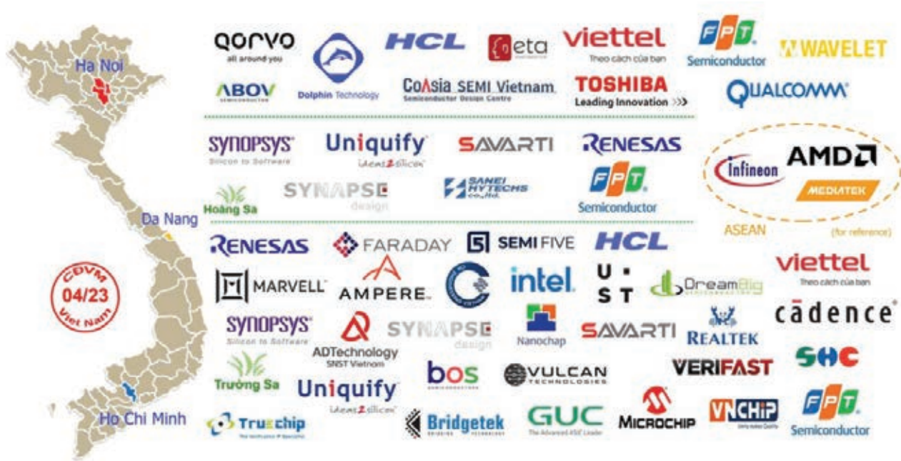
Các công ty hoạt động trong lĩnh vực bán dẫn tại Việt Nam.

dài hạn. Lãnh đạo của một tập đoàn công nghệ lớn ở Đài Loan (Trung Quốc) đã từng chia sẻ rằng: nếu tiêu tỷ USD thì lập hãng hàng không, còn nếu tiêu trăm tỷ USD thì nên lập công ty sản xuất chip bán dẫn. Điều đó cho thấy, ngành công nghiệp bán dẫn cần nguồn lực khổng lồ như thế nào. Trong khi thực lực Việt Nam còn nhiều hạn chế. Nhìn lại quá khứ, khi mới thành lập nhà máy ở Việt Nam, Intel đã gặp rất nhiều khó khăn khi tuyển dụng kỹ sư, thậm chí đã phải chi một khoản tiền không nhỏ để đưa người lao động Việt Nam ra nước ngoài đào tạo. Việt Nam không thiếu kỹ sư điện tử, công nghệ thông tin có trình độ, nhưng nhân lực trình độ cao trong lĩnh vực bán dẫn, đồng thời thông thạo ngoại ngữ để có thể nắm bắt ngay công việc vẫn