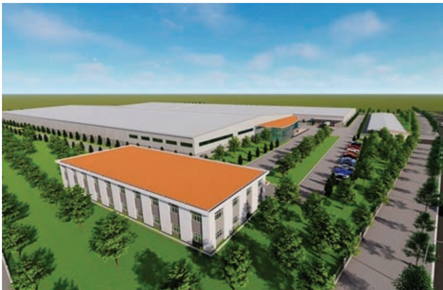
Phối cảnh mô hình nhà máy bán dẫn dự định xây dựng tại Khu Công nghệ cao Đà Nẵng.

xúc cấp Chính phủ. Bên cạnh đó, Việt Nam vẫn đang tiếp tục hoàn thiện môi trường kinh doanh thuận lợi và hấp dẫn cho các nhà đầu tư, doanh nghiệp, viện nghiên cứu, cơ sở đào tạo trong ngành công nghiệp bán dẫn. Đặc biệt, năm 2023, Bộ Kế hoạch và Đầu tư đã khánh thành Trung tâm Đổi mới Sáng tạo Quốc gia. Theo đó, nếu các doanh nghiệp nước ngoài đầu tư các dự án bán dẫn sẽ được áp dụng những ưu đãi cao nhất khi hoạt động tại đây. Việt Nam còn có 3 Khu Công nghệ cao đã được xây dựng và phát triển tại Hòa Lạc (Hà Nội), TP Hồ Chí Minh, Đà Nẵng với cơ sở hạ tầng hiện đại và nhiều cơ chế ưu đãi hấp dẫn luôn sẵn sàng chào đón các nhà đầu tư ngành bán dẫn. Tuy nhiên, để hỗ trợ ngành công nghiệp bán dẫn phát triển trong thời gian tới, Việt Nam