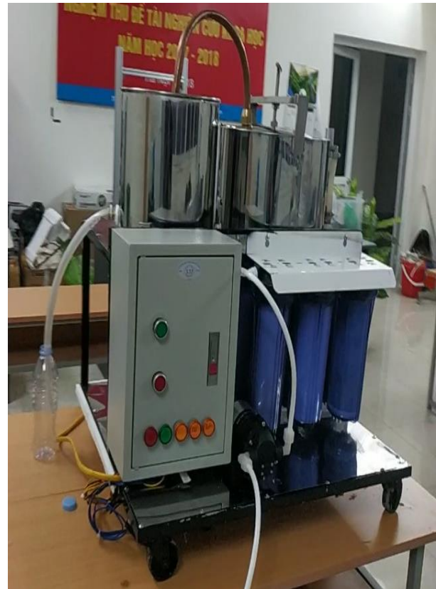
Hình 3. Hệ thống lọc nước biển thành nước ngọt